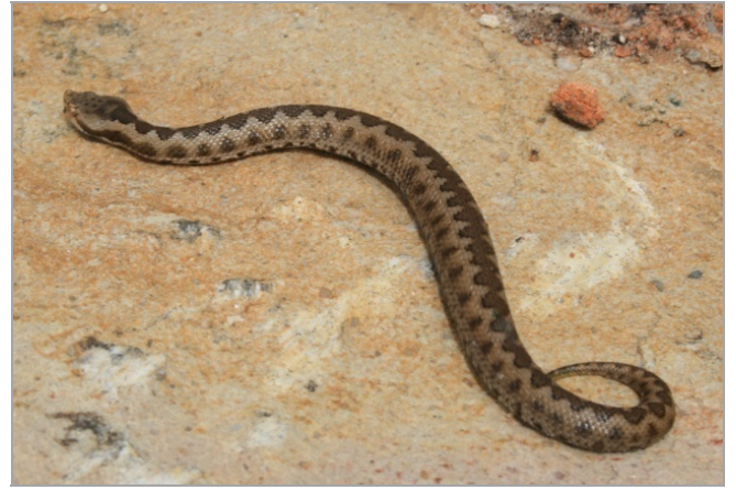
Photo 1a et b. Spécimen de Vipera latastei de Jbel Haouch