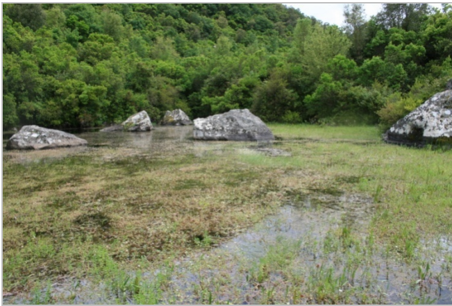
Photo 2. Habitat de Emys orbicularis au Jbel Haouch.